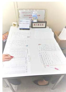
(最後のチェック中)

交付日は8月20日(金)となっています。第二回目の申請を6月29日(火)に行う予定です。こちらの方は交付日が指定されておらず、8月20日以降で随時郵送対応になるとのことです。